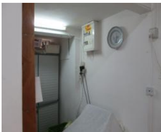
תמונה 2 : אולם הגן